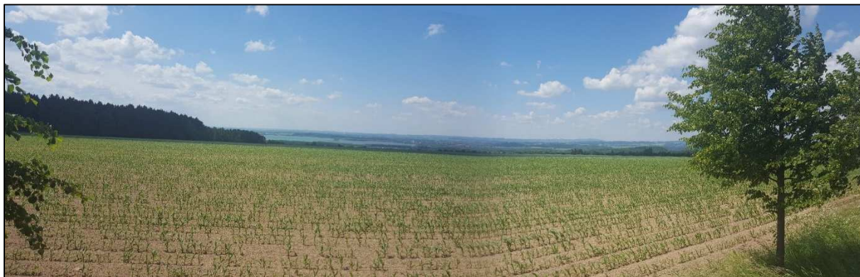
Pohled na Rozkoš od Vysokova